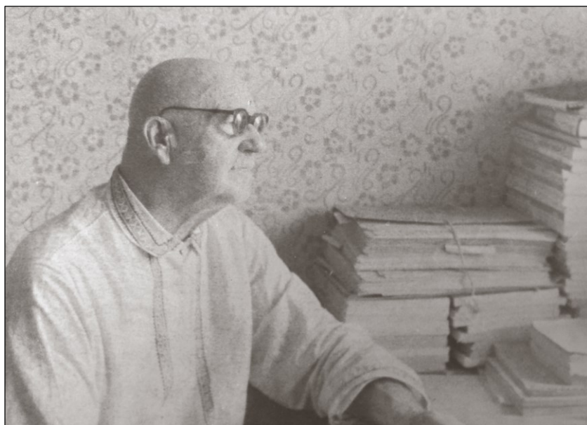
За работой. 1978 г.